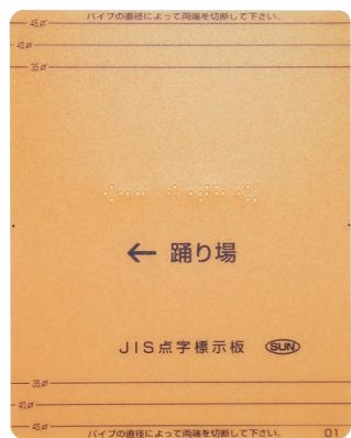
HS-1J-CC(チャコールグレー)