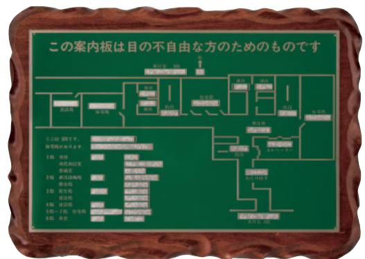
1975年(昭和50年)9月、京都市役所に納入した日本で最初の点字案内板